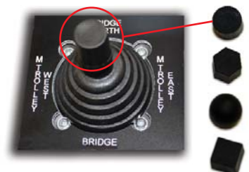
Různá zakončení joysticky