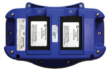
Hlavní a záložní baterie